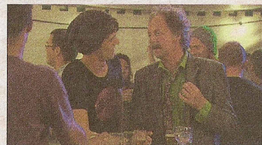
Twee kleurrijke figuren in gesprek in de feesttent.

jaren na een dramatisch ongeval weer ontmoeten tijdens een dorpsfeest. Bij het ongeluk kwam Ronnies broer, tevens Milja's geliefde, om het leven. Dat de twee iets voor elkaar beginnen te voelen is een schokkend besef, vooral voor Ronnie en Milja zelf.